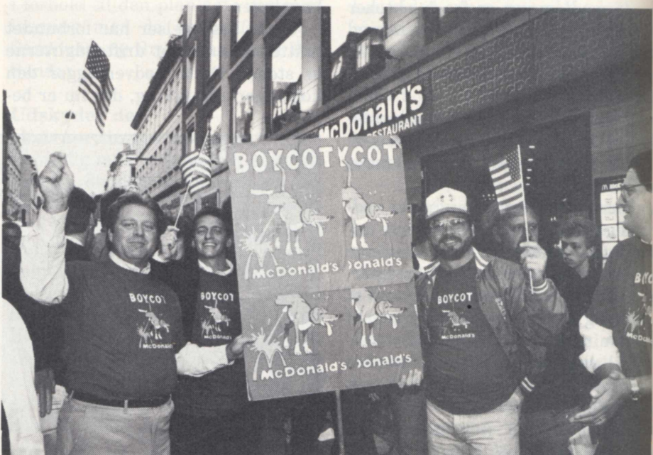
Besøgende fra hamburgerkædens hjemland: Ja til aftaler – de unge skal sikres rettigheder.