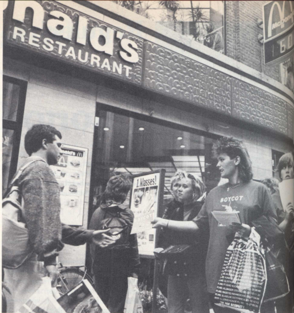
Udleveringen af orienteringsmateriale til de ansatte hos McDonald's blev forhindret af forretningens ledere, men ude på gaden var der afsætning på løbesedlerne.

Generelt henviser burger-restauratørerne til, at det er de ansatte, der