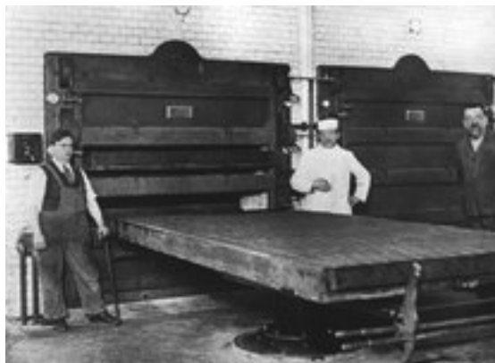
Et af de kooperative fællesbagerier

Han tildeles prisen, fordi han med udgangspunkt i et selvstændigt og grundigt kildearbejde analyserer sig frem til årsagerne bag fællesbageriernes succes og senere vanskeligheder.