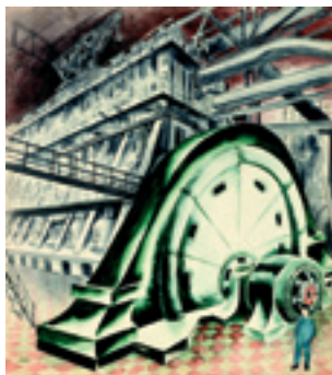
Anton Hansen "Verdens største dieselmotor", 1932, akvarel, Arbejdermuseet.

Butikken byder også på et stort udvalg af kunstbøger til en særdeles billig pris i den kommende periode. I bøgerne kan man læse mere om nogle af de værker, der er med på særudstillingen "MED MENNESKER".