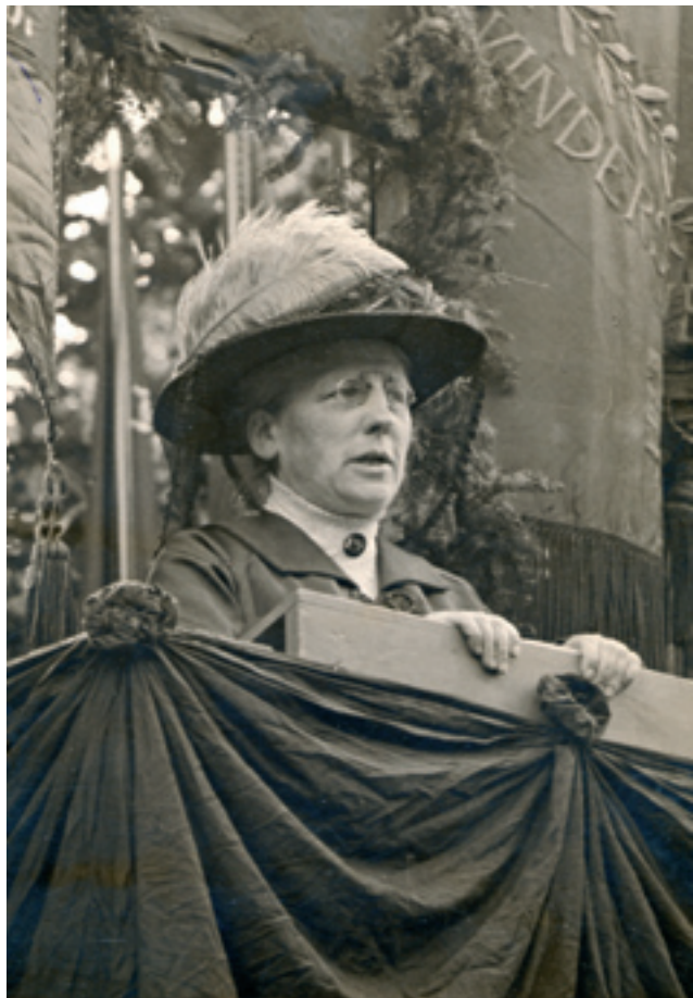
Det kendte foto af Nina Bang på talerstolen.

Danmarks første kvindelige minister Nina Bang (født Ellinger) tiltrådte 23. april 1924 kl. 16 efter at have været hos kongen dagen forinden til den officielle udnævnelse. Hun blev undervisningsminister i Danmarks første socialdemokratiske regering.