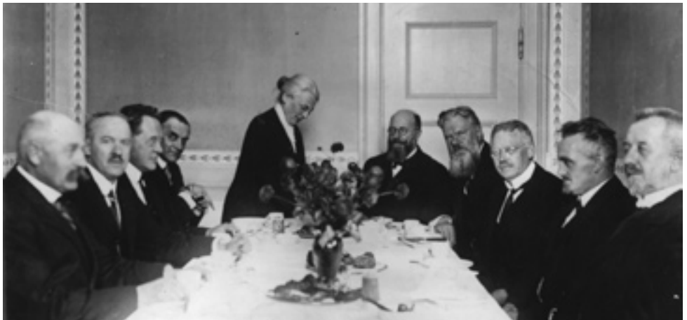
Her markeres hendes fødselsdag med varm chokolade til ministerkollegaerne.

I anledning af Nina Bangs 60 års fødselsdag gav sprogforskeren Lis Jacobsen måske den bedste beskrivelse af Nina Bang og hendes politiske liv. ”Hendes Bevæggrunde er ikke personlige, men ideelle: Hun tror paa Socialismens Idé og handler uden taktiske Sidehensyn, i ret Linie efter sin Overbevisning.”