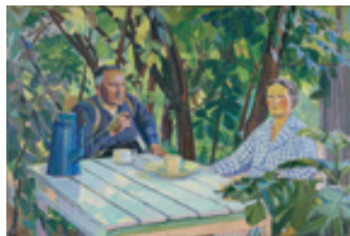
Alfred Jensen "Mine forældre", 1949, olie på sække-lærred, Arbejdermuseet.

Motivet er blevet lavet som postkort og kan købes i museumsbutikken sammen med en række andre postkort, der viser motiver fra museets egen samling af kunst.