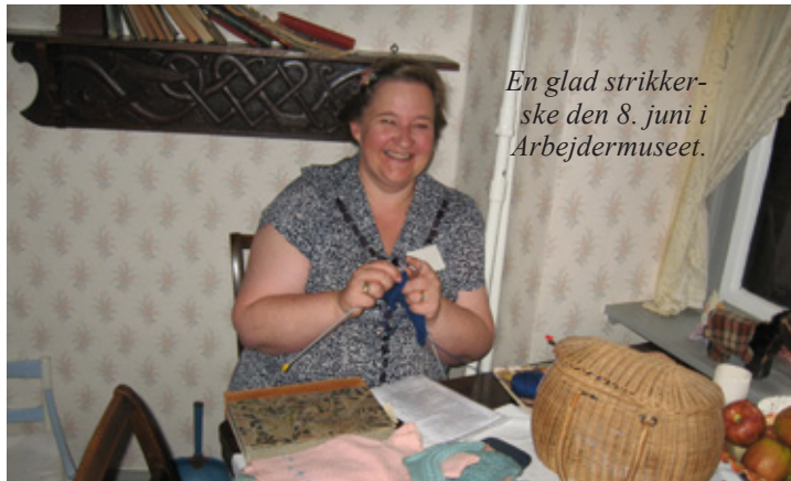
En glad strikkesker den 8. juni i Arbejdermuseet.

Dagen oprandt, og i gården blev jeg mødt af de fornøjeligste og festligste strikkekvinder, jeg nogensinde har set. De havde gjort rigtig meget ud af både humør, påklædning og strikkelyst og havde grin og historier med i de strikkede ærmer. Jeg kom med lidt praktisk information og uddelte lidt papir til opstående idéer, rettelser, ris, ros og gæsternes indfald, hvorefter jeg fik vist dem deres pladser. Ved hver plads var der en kurv med garn samt pinde til gæsterne, hvis de havde lyst til at afprøve kunsten. Der lå også lidt færdigstrikket at vise, og gratis opskrifter på det der blev strikket.