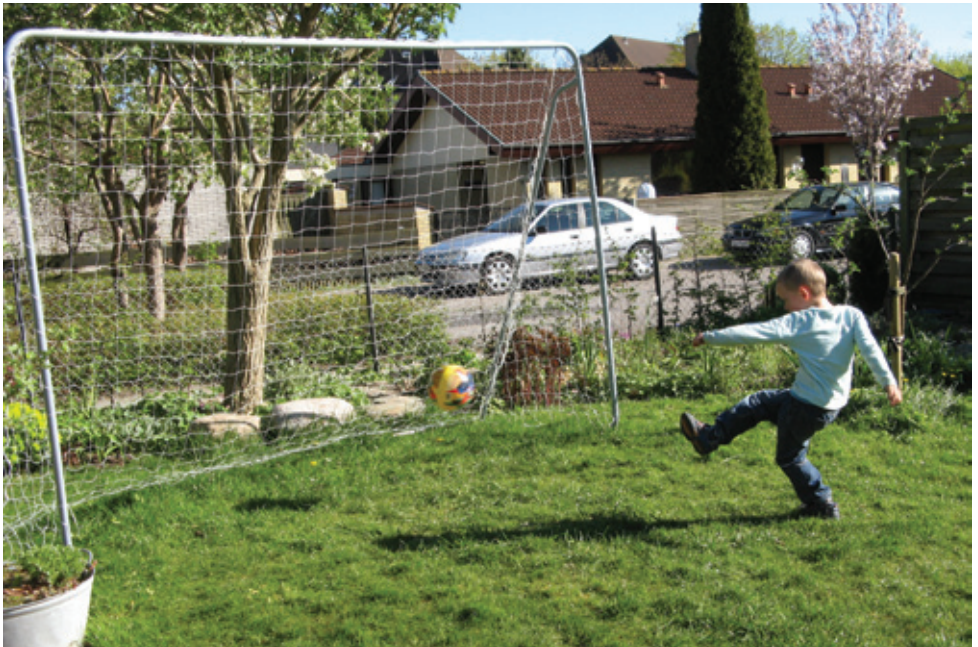
Så var der mål! Bredekærs Vænge, Ishøj, 2012.