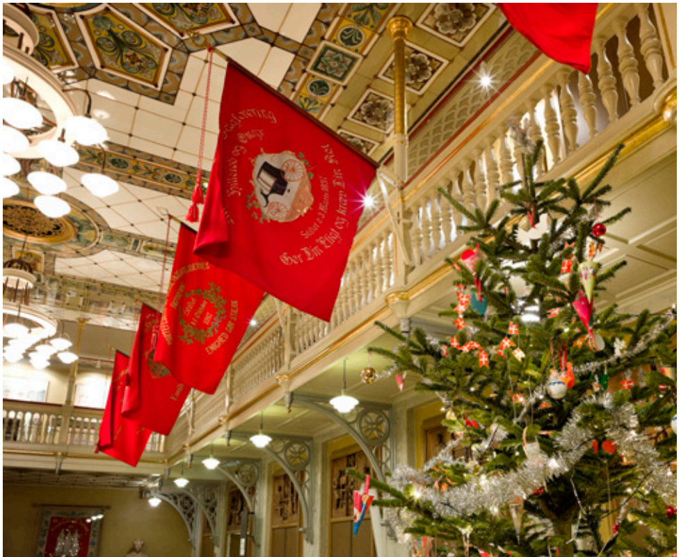
Kom til juletræsfest i festsalen.

Kom til den traditionsrige juletræsfest, hvor nisserne spiller op til dans i den smukke festsal.