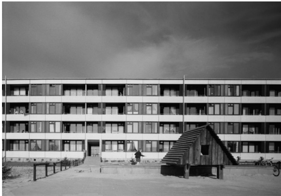
Den store forstadsbebyggelse ved Odense, Vollsmose.

Udstillingerne er støttet af Realdania, Bikubenfonden og Kulturstyrelsen.