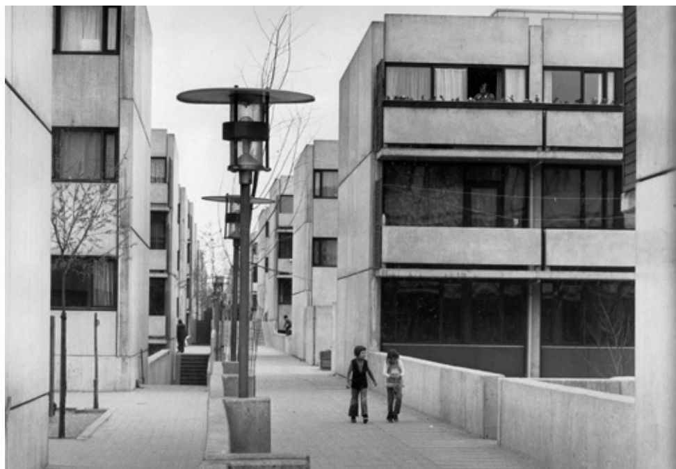
Boligbebyggelsen Brøndby Strand