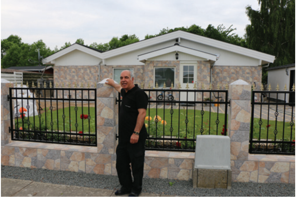
Nyombygget parcelhus i Bredekærs Vænge, Ishøj 2014.