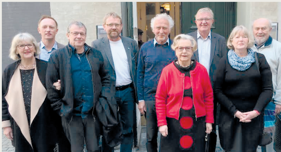
Bestyrelsen (fra v.):