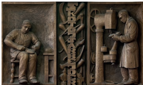
Pelle Erobreren bliver skomager – ligesom forfatteren Martin Andersen Nexø selv.

Fortællingen om landarbejdernes fattige og barske kår i slutningen af det 19. Århundrede har sammen med museets udstilling "Familien Sørensen" dannet ramme om en workshop, hvor de unge deltagere har sat lyd og lyrik til deres fortolkninger af Pelle Erobreren og perspektiveret den til deres egen tid.