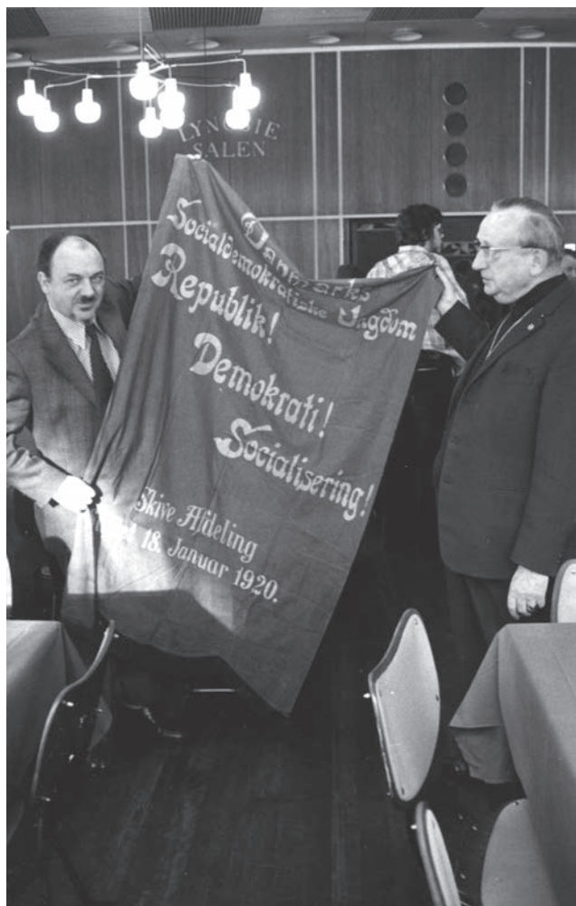
ABA indvier sine nye lokaler på 2. sal i Folkets Hus, 1976

Arbejdermuseet & ABA befinder sig således midt i en afklaringsproces, der både har tekniske, juridiske og ressourcemæssige udfordringer, men det er institutionens begrundede håb, at Arbejdermuseet og ABA i en overskuelig fremtid i tæt og tillidsfuldt samarbejde med bevægelsen og andre relevante partnere kan bringe arkivet, biblioteket og museet ind i en digital fremtid.