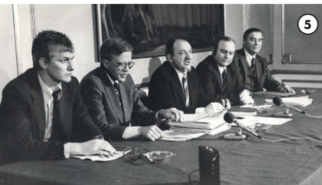
5. Det var kutyme i Anker Jørgensens regeringstid at regeringen greb ind i overenskomstforhandlingerne. Her er det den historiske SV-regering, der præsenterer et lovindgreb i 1979. Fra venstre mod højre: For Socialdemokratiet Svend Auken, Knud Heinesen og Anker Jørgensen, og fra Venstre Henning Christophersen og Anders Andersen.