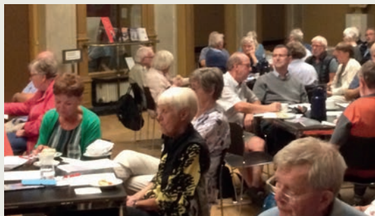
Kulturminister Joy Mogensen talte om museer og kulturpolitik