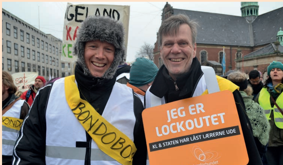
Lærere til demonstration ved Christiansborg slot d. 11. april 2013.

I anledning af 10-året for lockouten udstilles denne perleplade nu i Arbejdermuseets festsal hen over påskeferien 2023 (1. april – 10. april), for at sætte fokus på en historisk konflikt på det danske arbejdsmarked.